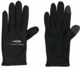
防寒におすすめ ラングローブ