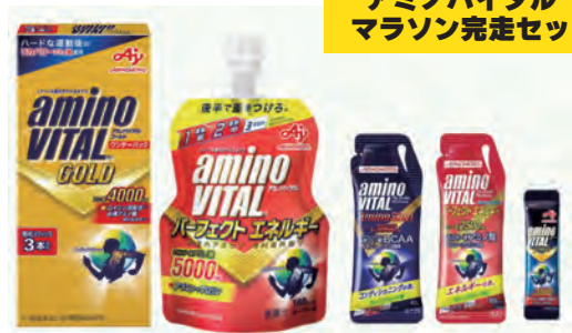
アミノバイタル® マラソン完走セット

掲載URL(公式オンラインストアやアプリのリンク): https://store.alpen-group.jp/