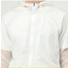
防寒におすすめ ウインドブレーカー